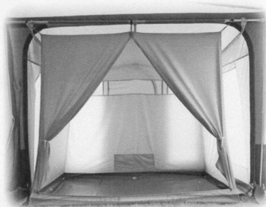
INTERIOR Anexo OPCIONAL